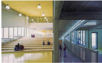
XIII © Robert Les

Das Herzstück dieses teilweise realisierten Projekts in Ljubljana ist ein spiralförmiger Verbindungsweg, der durch einen Innenhof verläuft, das alte Gebäude durchquert und so alle Räume des Museums verbindet, das im Laufe der Jahrhunderte zahlreiche Ergänzungen erfahren hat.