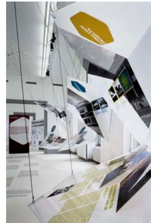
XXIV © Tom Bisig