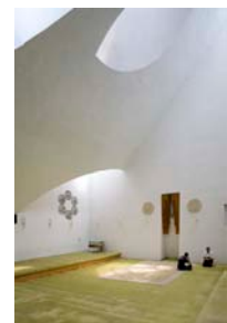
VI ©Wolfgang Thaler

Die Erdbebenkatastrophe 1963 zerstörte das Zentrum Skopjes. Den jugoslawischen Wettbe- werb für einen neuen Kulturkomplex gewan- nen slowenische Architekten mit einer freien Komposition aus scharfkantigen, skulpturalen, expressionistischen Gebäuden. Es wurden je- doch nur der Opern- und der Ballettsaal mit den angrenzenden Gebäudeeinheiten gebaut.