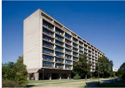
II ©Wolfgang Thaler

Die 1983 errichtete Bibliothek in Prishtina ist der interessante Fall eines sich ausbildenden strukturalistischen Ansatzes und der Bezug- nahme auf Formen islamischer Architektur.