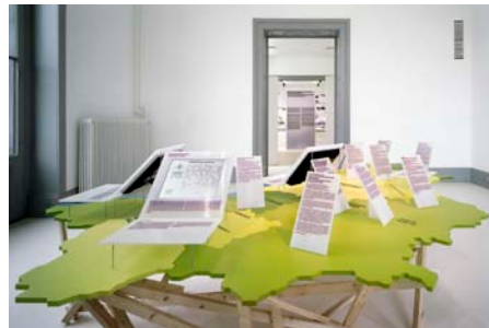
XXVI © Tom Bisig