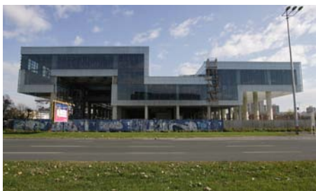
XV © Bruno Bahunek

Das Gymnasium in Koprivnica wurde von jungen Architekten «unter 30» entworfen und schafft sich seinen eigenen Kontext, da es sich durch Grösse und Aussehen klar von der Umgebung abhebt. Mehrzweckhalle und Schule sind in einer lichtdurchlässigen Hülle aus Polykarbonat kompakt untergebracht.