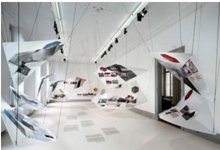
XXII © Tom Bisig