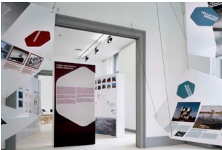
XXV © Tom Bisig