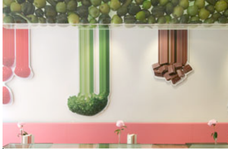
Regali per Pata