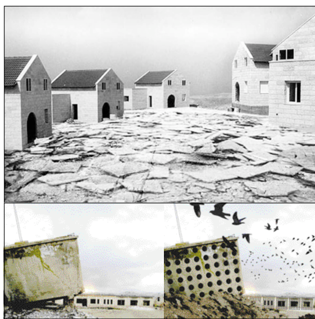
In alto, collage con esempio di distruzione dei primi 10 cm di suolo per la colonia di P'sagot; sopra, ipotesi di crivellazione di strutture militari a Oush Grab

Lo studio della colonia di P'sagot permette la definizione di una sorta di manuale per la decolonizzazione. La strada proposta dai curatori è quella della sovversione: ritorcere il potenziale delle architetture contro se stesse, senza distruggerle, come invece si è fatto a Gaza, o riutilizzarle, accettandone il potenziale ideologico. Sovversione significa cancellazione della logica della colonia/suburb, la sua