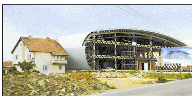
Edificio a Priština, in Kosovo

La mostra mette in campo una serie di argomenti intorno alla questione architettonica e li presenta stampati su aquiloni, sospesi nel vuoto della sala. A terra si riflettono i commenti del curatore Vladimir Kulič, storico dell'architettura, e di Maroje Murduljaš, redattore della rivista croata di architettura «Oris».